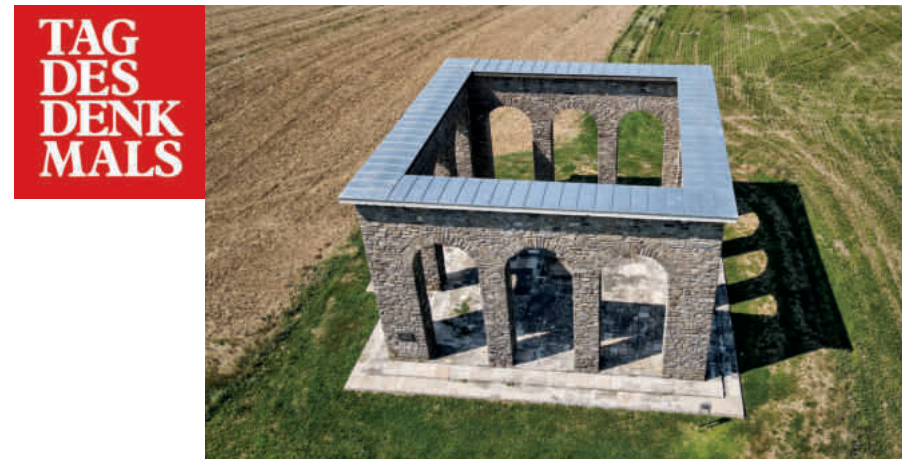
»Anschlussdenkmal«, 2020